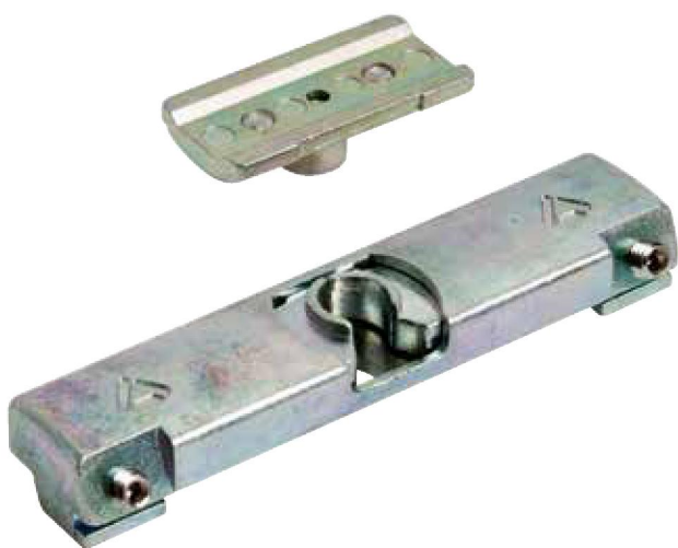
COLOCACIÓN Y ESQUEMA DE MONTAJE